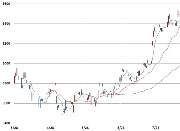
전기동 가격과 이동평균선(5, 20, 60)