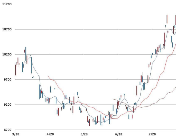
니켈 가격과 이동평균선(5, 20, 60)