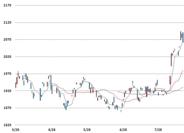
알루미늄 가격과 이동평균선(5, 20, 60)