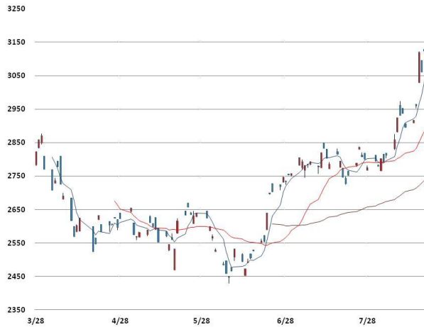
아연 가격과 이동평균선(5, 20, 60)