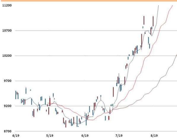
니켈 가격과 이동평균선(5, 20, 60)