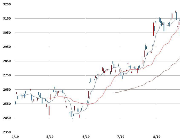
아연 가격과 이동평균선(5, 20, 60)