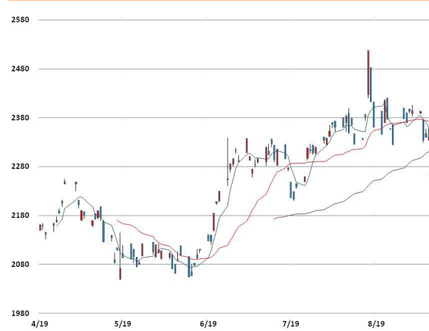
납 가격과 이동평균선(5, 20, 60)