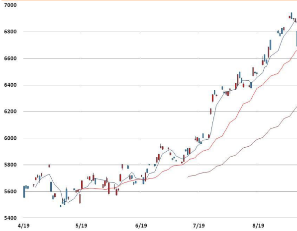
전기동 가격과 이동평균선(5, 20, 60)