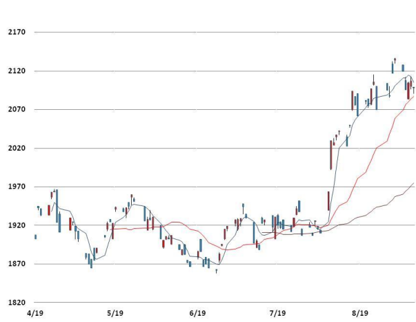
알루미늄 가격과 이동평균선(5, 20, 60)