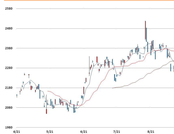
납 가격과 이동평균선(5, 20, 60)