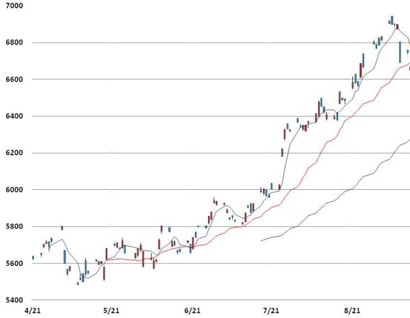
전기동 가격과 이동평균선(5, 20, 60)