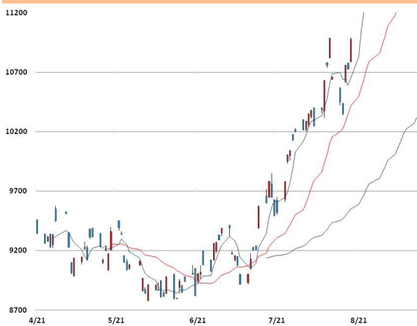
니켈 가격과 이동평균선(5, 20, 60)