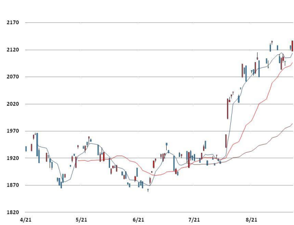
알루미늄 가격과 이동평균선(5, 20, 60)