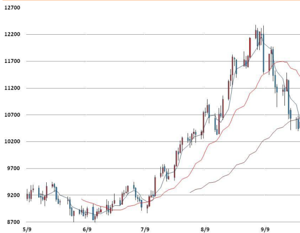
니켈 가격과 이동평균선(5, 20, 60)