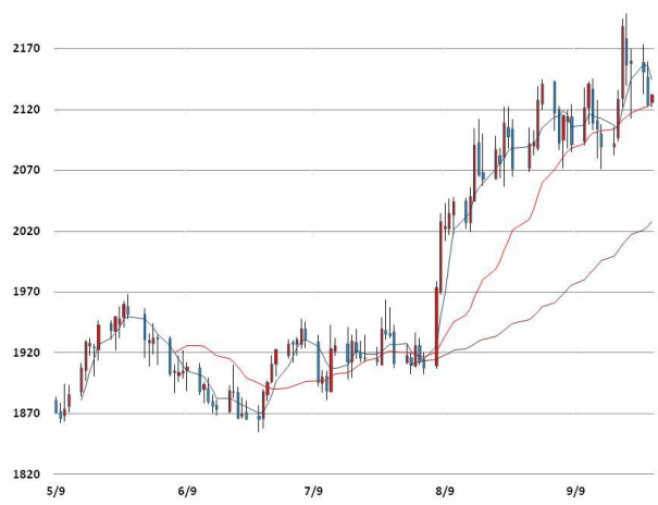
알루미늄 가격과 이동평균선(5, 20, 60)