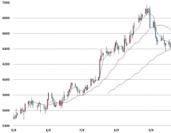
전기동 가격과 이동평균선(5, 20, 60)