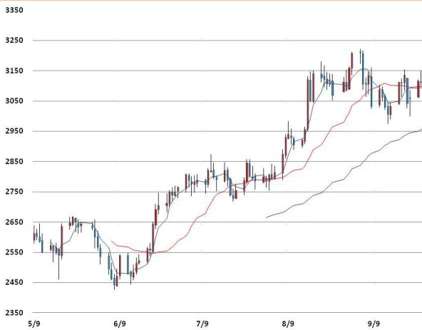
아연 가격과 이동평균선(5, 20, 60)