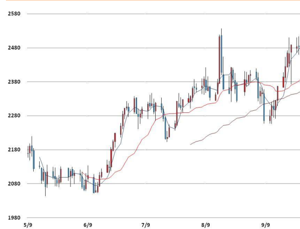
납 가격과 이동평균선(5, 20, 60)