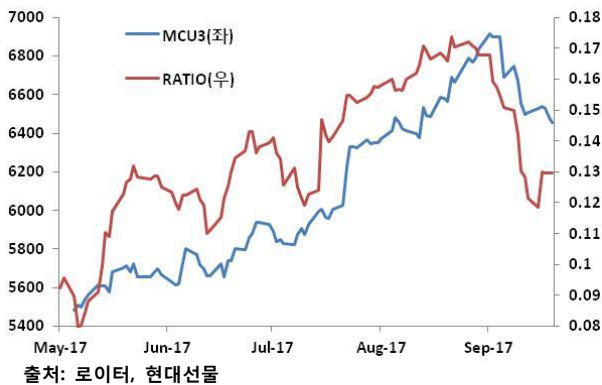
그림 1. LME CU, 가격과 투기적 비율 추이 비교