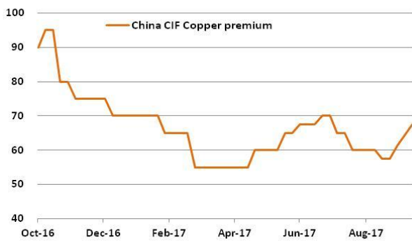
그림 2. 중국 CIF 전기동 현물 프리미엄 추이