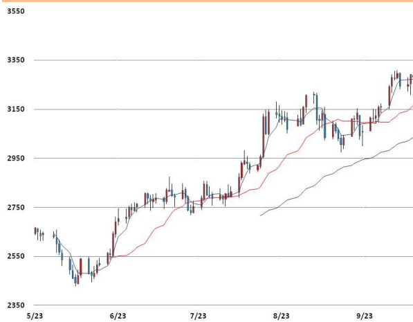
아연 가격과 이동평균선(5, 20, 60)