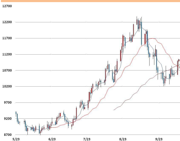
니켈 가격과 이동평균선(5, 20, 60)