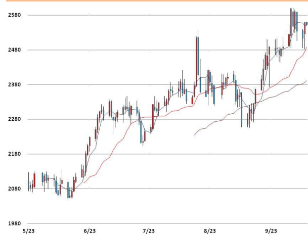
납 가격과 이동평균선(5, 20, 60)