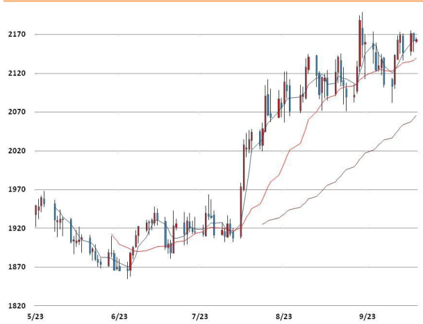
알루미늄 가격과 이동평균선(5, 20, 60)