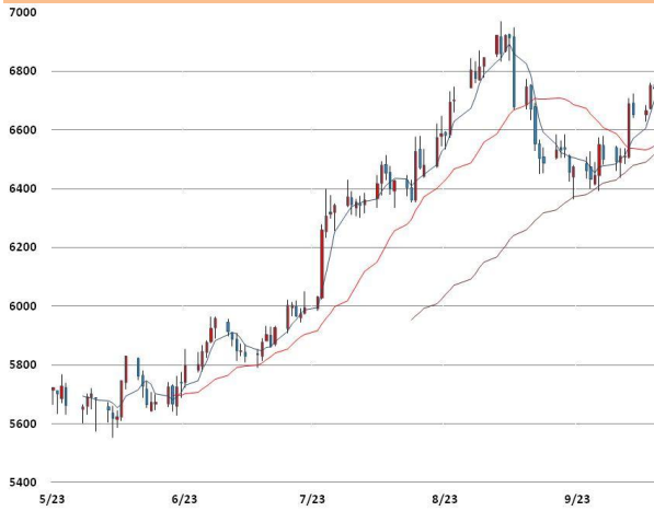
전기동 가격과 이동평균선(5, 20, 60)