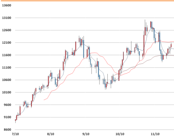
니켈 가격과 이동평균선(5, 20, 60)