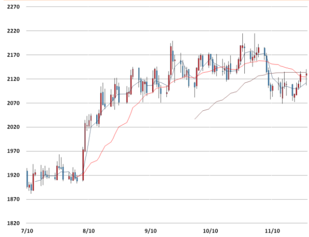
알루미늄 가격과 이동평균선(5, 20, 60)