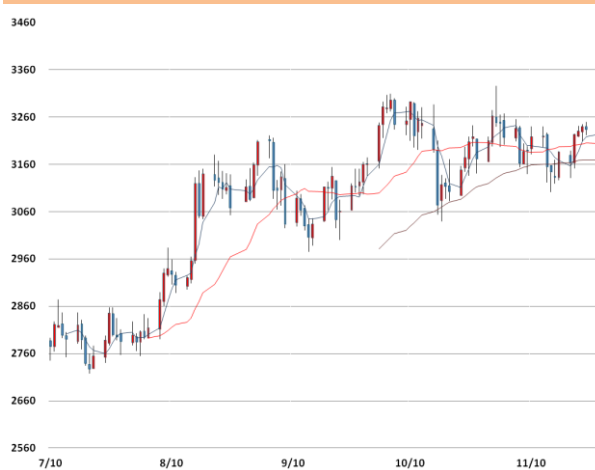
아연 가격과 이동평균선(5, 20, 60)