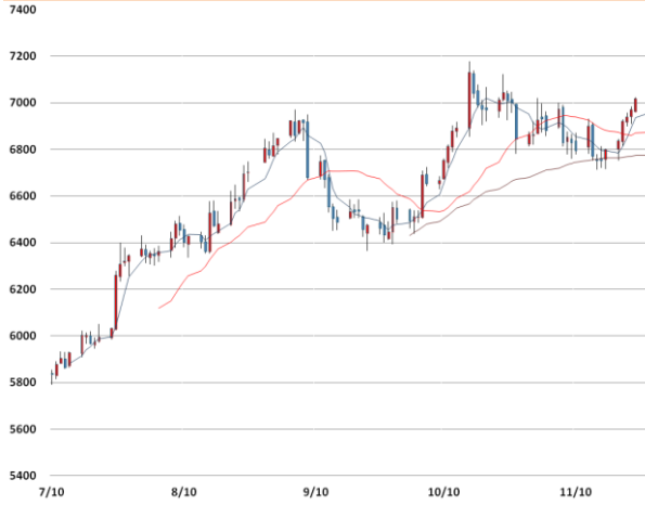
전기동 가격과 이동평균선(5, 20, 60)