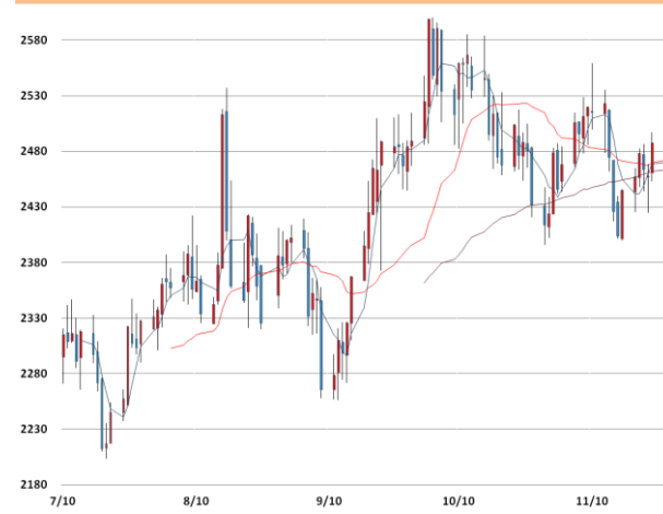
납 가격과 이동평균선(5, 20, 60)