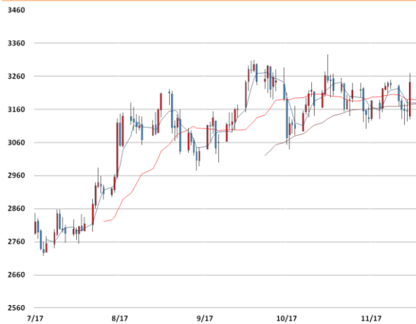
아연 가격과 이동평균선(5, 20, 60)