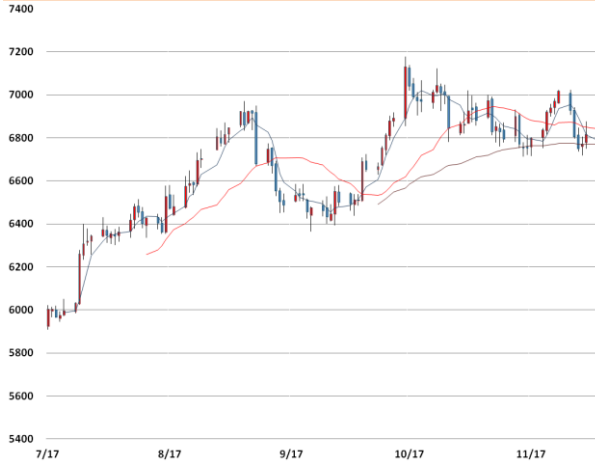
전기동 가격과 이동평균선(5, 20, 60)