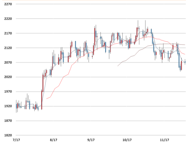
알루미늄 가격과 이동평균선(5, 20, 60)