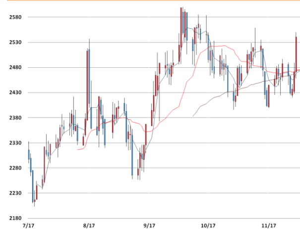
납 가격과 이동평균선(5, 20, 60)