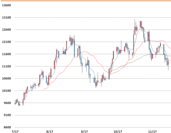
니켈 가격과 이동평균선(5, 20, 60)