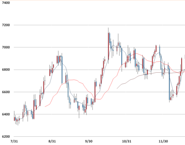
전기동 가격과 이동평균선(5, 20, 60)