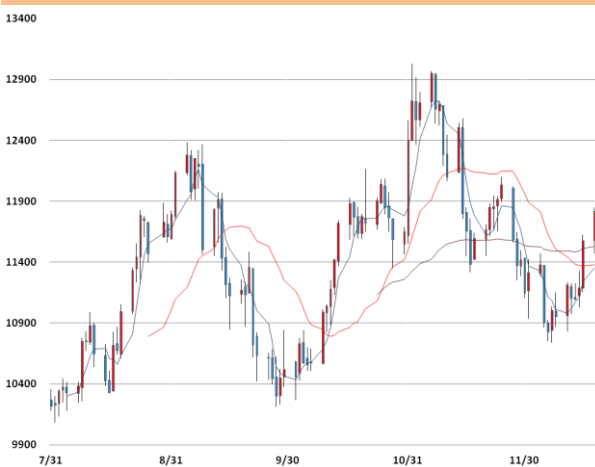
니켈 가격과 이동평균선(5, 20, 60)