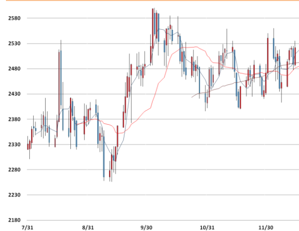
납 가격과 이동평균선(5, 20, 60)