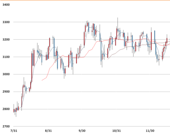
아연 가격과 이동평균선(5, 20, 60)