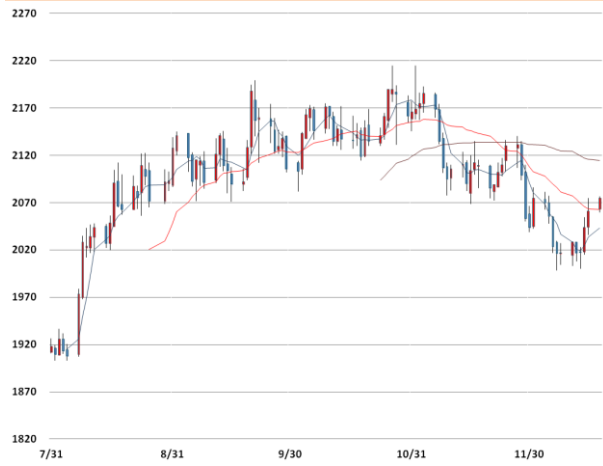
알루미늄 가격과 이동평균선(5, 20, 60)