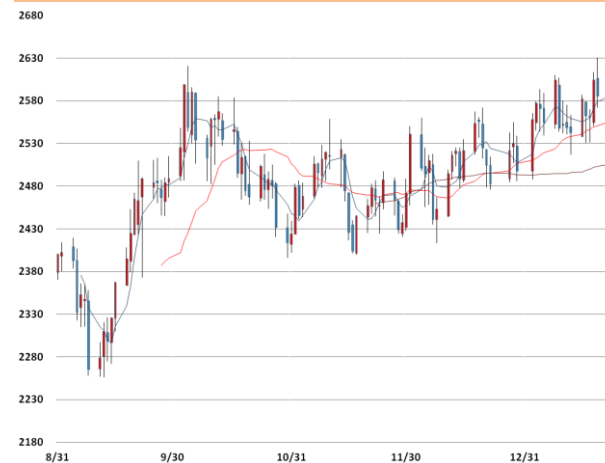
납 가격과 이동평균선(5, 20, 60)