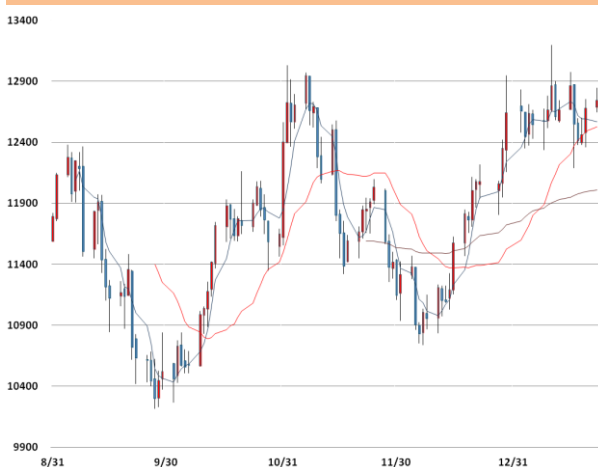
니켈 가격과 이동평균선(5, 20, 60)