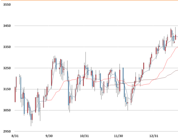
아연 가격과 이동평균선(5, 20, 60)