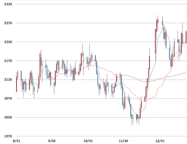
알루미늄 가격과 이동평균선(5, 20, 60)