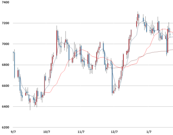
전기동 가격과 이동평균선(5, 20, 60)