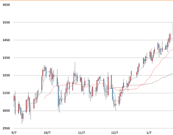
아연 가격과 이동평균선(5, 20, 60)