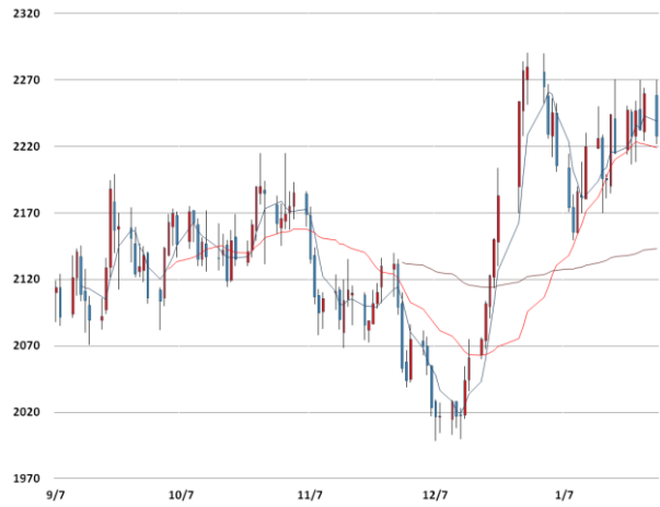
알루미늄 가격과 이동평균선(5, 20, 60)