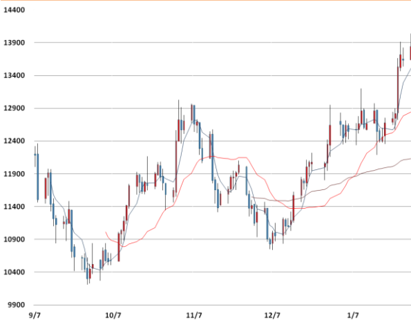
니켈 가격과 이동평균선(5, 20, 60)