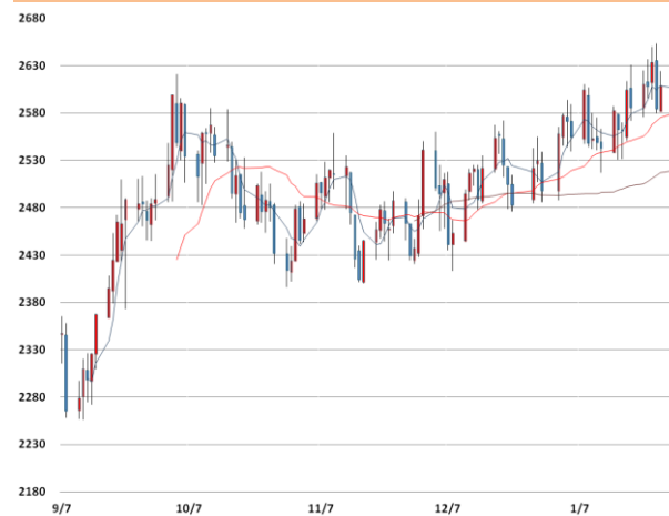
납 가격과 이동평균선(5, 20, 60)