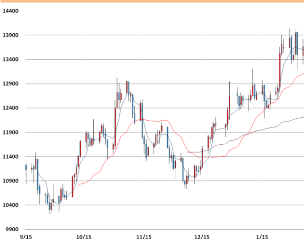
니켈 가격과 이동평균선(5, 20, 60)