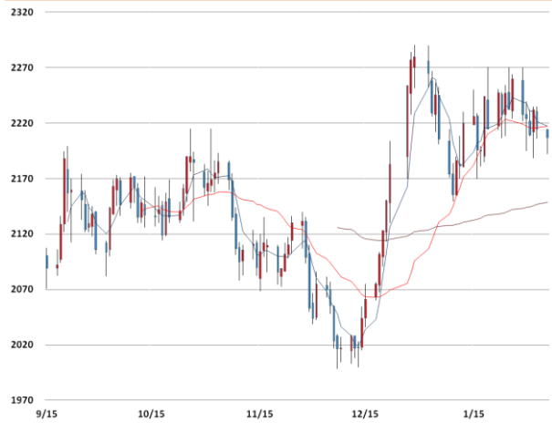
알루미늄 가격과 이동평균선(5, 20, 60)