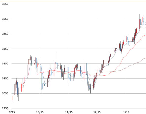
아연 가격과 이동평균선(5, 20, 60)