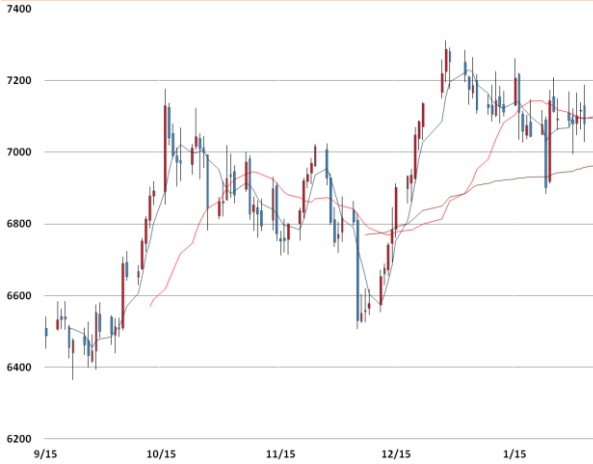
전기동 가격과 이동평균선(5, 20, 60)