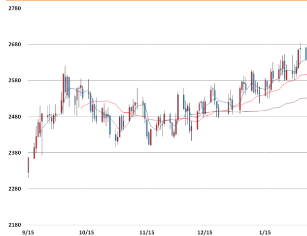
납 가격과 이동평균선(5, 20, 60)