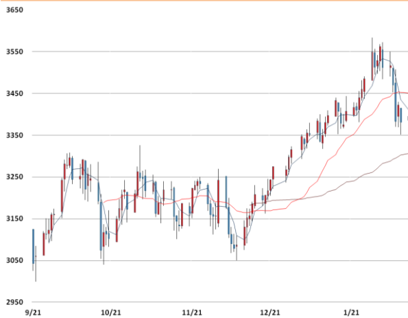
아연 가격과 이동평균선(5, 20, 60)