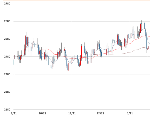
납 가격과 이동평균선(5, 20, 60)