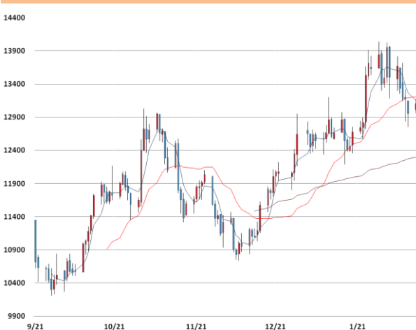
니켈 가격과 이동평균선(5, 20, 60)