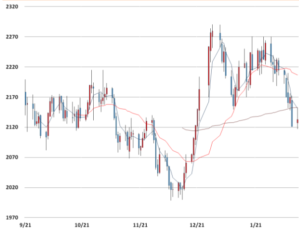
알루미늄 가격과 이동평균선(5, 20, 60)