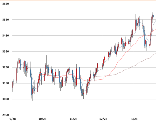
아연 가격과 이동평균선(5, 20, 60)