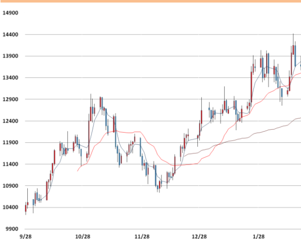
니켈 가격과 이동평균선(5, 20, 60)