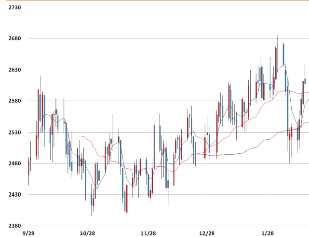
납 가격과 이동평균선(5, 20, 60)