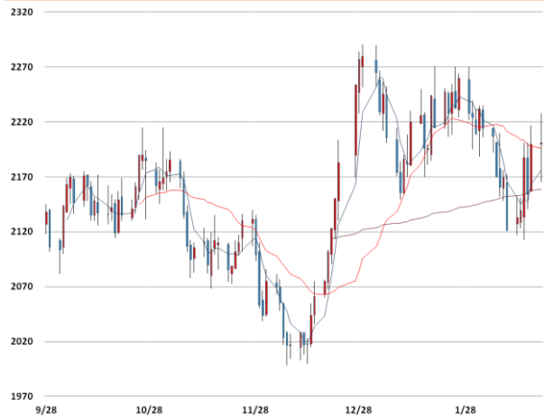
알루미늄 가격과 이동평균선(5, 20, 60)