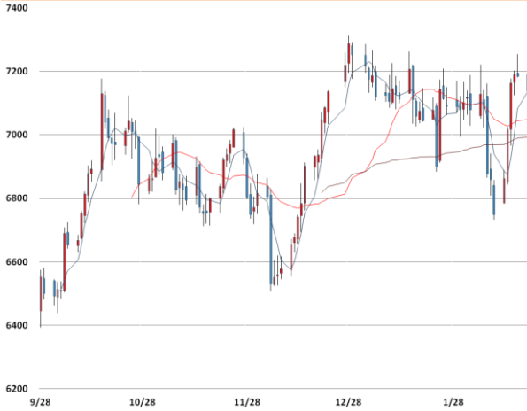
전기동 가격과 이동평균선(5, 20, 60)