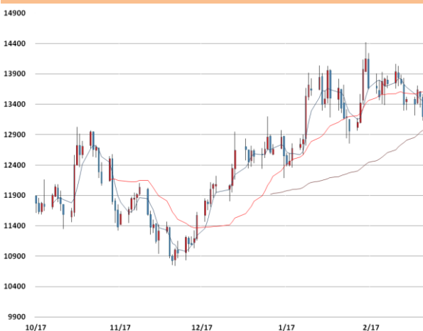
니켈 가격과 이동평균선(5, 20, 60)