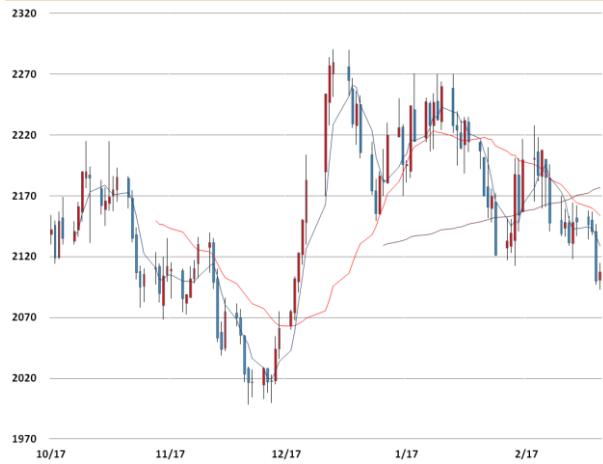
알루미늄 가격과 이동평균선(5, 20, 60)