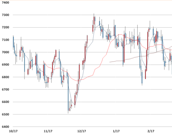
전기동 가격과 이동평균선(5, 20, 60)