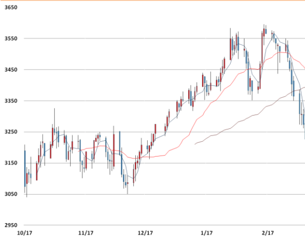
아연 가격과 이동평균선(5, 20, 60)