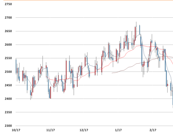
납 가격과 이동평균선(5, 20, 60)