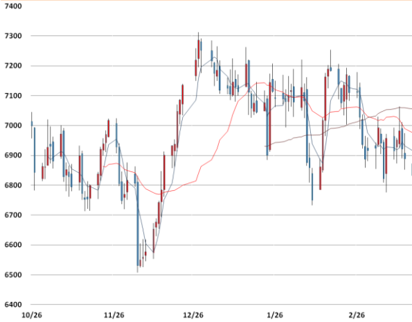
전기동 가격과 이동평균선(5, 20, 60)