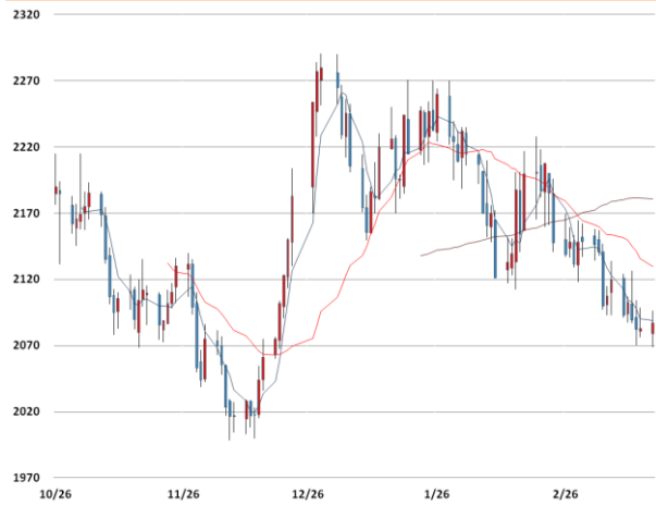
알루미늄 가격과 이동평균선(5, 20, 60)