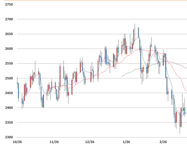
납 가격과 이동평균선(5, 20, 60)