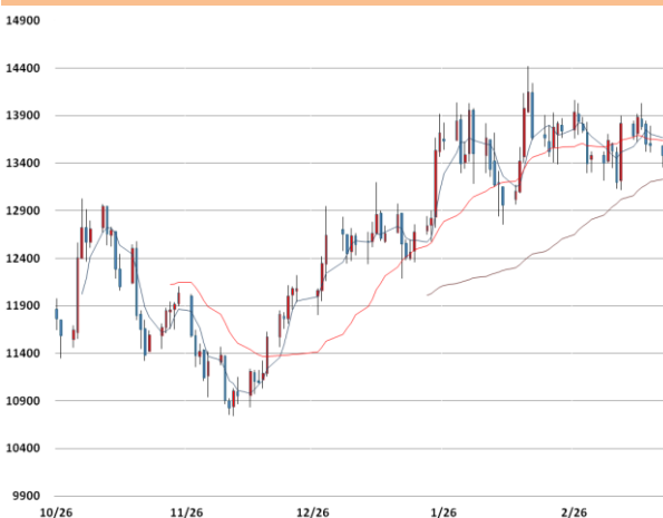
니켈 가격과 이동평균선(5, 20, 60)