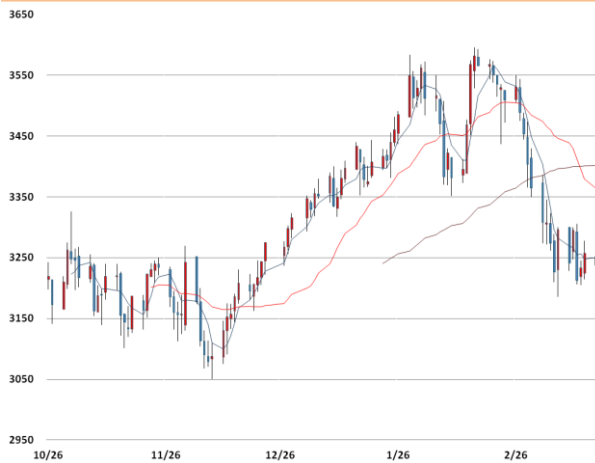
아연 가격과 이동평균선(5, 20, 60)