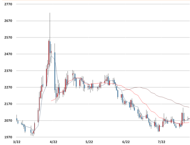
알루미늄 가격과 이동평균선(5, 20, 60)