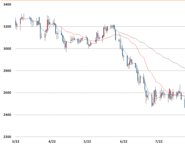
아연 가격과 이동평균선(5, 20, 60)