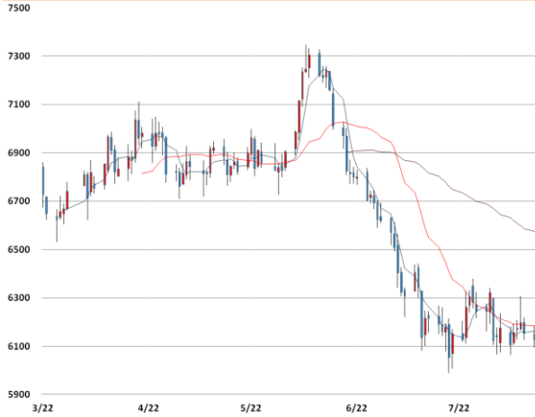
전기동 가격과 이동평균선(5, 20, 60)