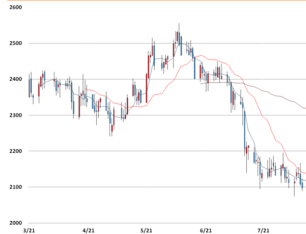
납 가격과 이동평균선(5, 20, 60)