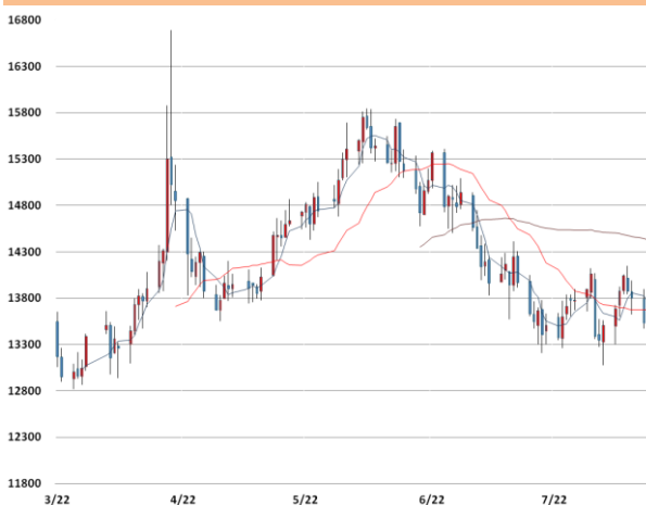
니켈 가격과 이동평균선(5, 20, 60)